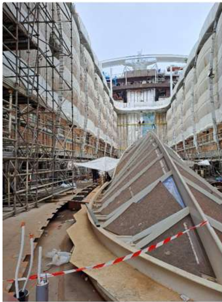
Etat du Central Park actuel