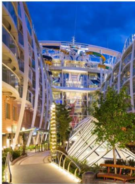
Etat du Central Park terminé

La fin des travaux est prévue pour la fin d'année, notre client, Chantiers de l'Atlantique, nous sollicitera cependant pour des activités complémentaires jusqu'en Mai 2024, la livraison du navire.