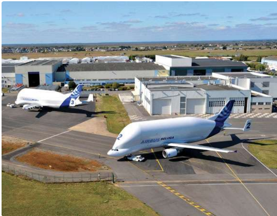
@Victor FORRAY - Resp. Dept. Contrats