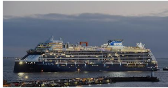
L34 : Celebrity Beyond Essais mer du 2 au 4 février 2022

W34 : MSC World Europa - Poursuite des fermetures de plafonds dans les locaux publics et dans les zones USPHS qui rentre dans sa phase intense (montage, finitions et vente). Des travaux complémentaires retiennent les équipes pour assister le client sur la fin des travaux.